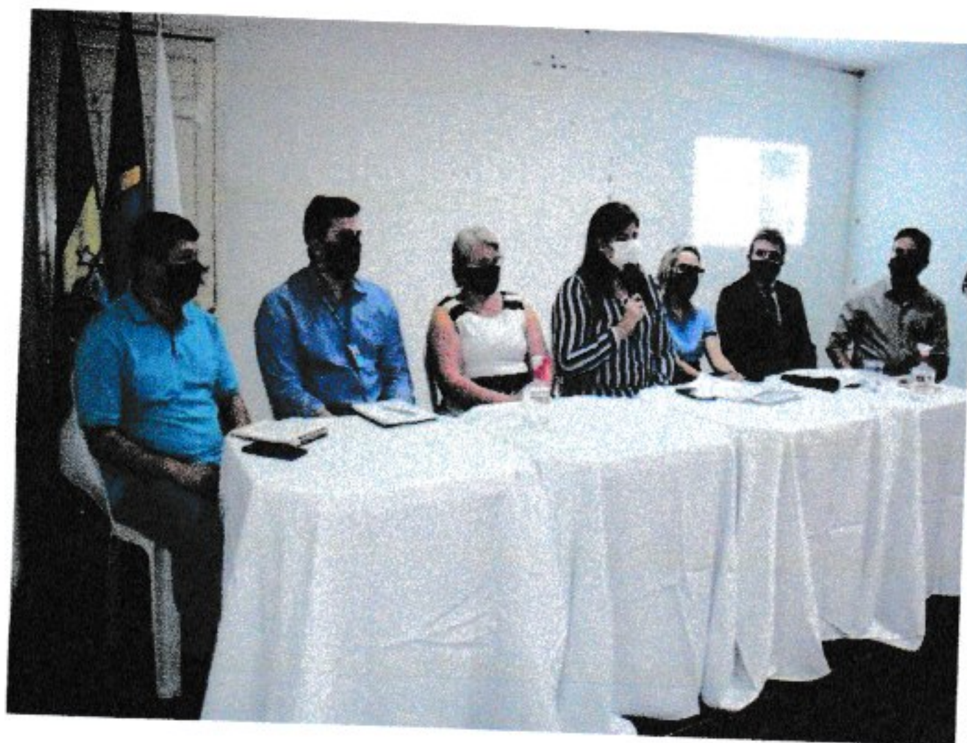
IMAGEM: André Mendes