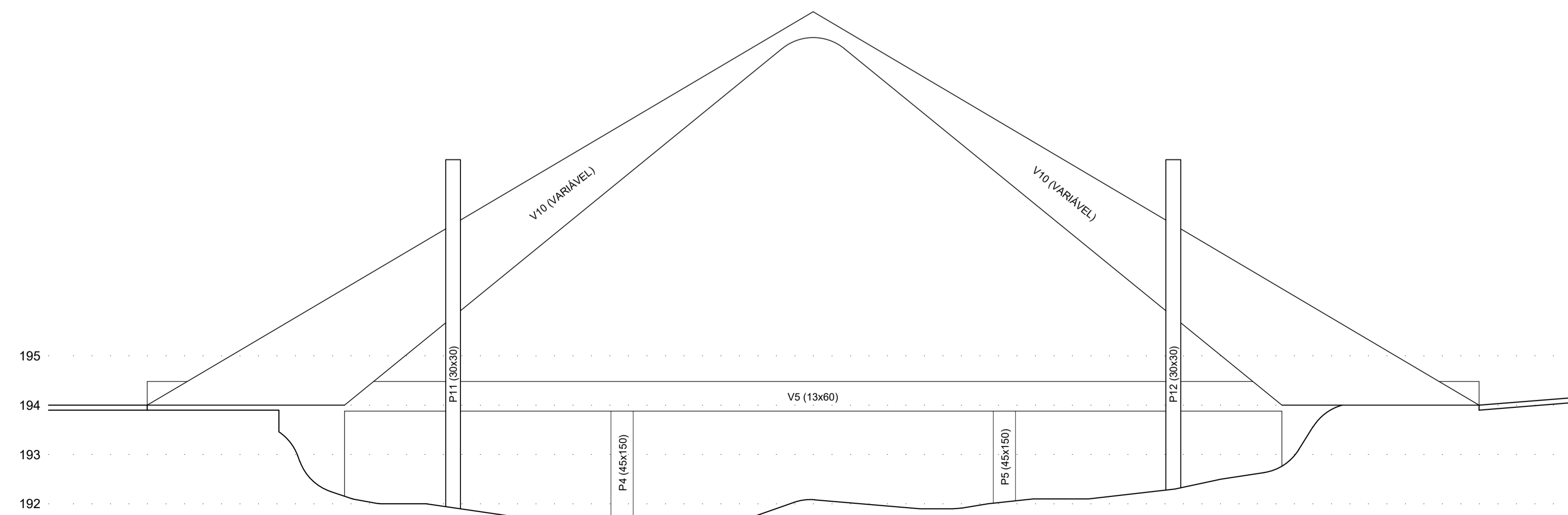
VISTA FRONTAL escala 1/75