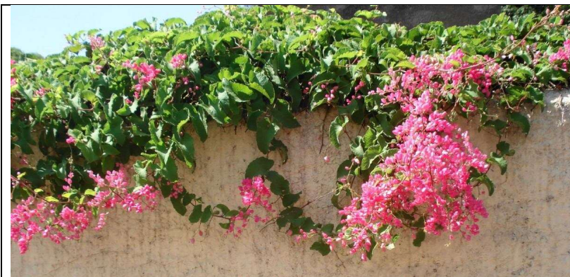
TREPADEIRA AMOR AGARRADINHO