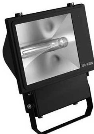
Figura 2: Imagem ilustrativa do refletor.

Os refletores serão retangulares e fechado com lâmpada de vapor metálico de 400W de potência. Instalados conforme projeto elétrico.