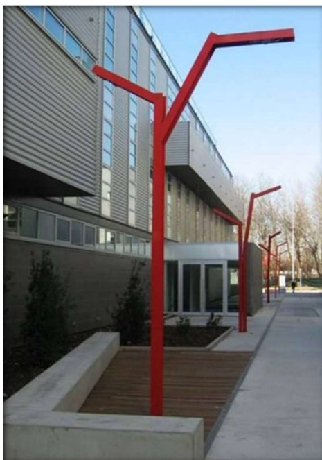
Figura 1: Imagem ilustrativa do poste.

Os postes serão em aço galvanizado, de seção quadrada d=100\text{mm} , pintado de vermelho, terão inclusive base concreto, lâmpadas de vapor mercúrio 250W, luminárias decorativas, tipo arandela, com refletor estampado em disco de alumínio anodizado, lente plana de cristal temperado.