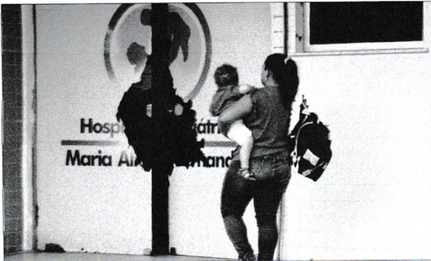
Unidade tem dez leitos pediátricos e profissionais terceirizados para os plantões. Mensalmente, 25 crianças são internadas na UTI

A Sesap apontou ainda que em média 25 crianças e adolescentes se internam, por mês, na UTI pediátrica. A unidade comporta dez leitos na pediatria e conta com profissionais terceirizados, via cooperativa, para os plantões. Somente a coordenadora dessa seção é servidora efetiva. Para o presidente da Sociedade de Pediatria do Rio Grande do Norte (Sopern), Reginaldo Holanda, a localização do hospital é uma razão para o desinteresse dos pediatras. Além disso, ele relatou que os honorários dos médicos não são pagos em dias fixos. "Se fechar dez leitos de UTI pediátrica por falta de acordo, de ajustes, vai ser um aumento de mortalidade de crianças e adolescentes, especialmente nessa época do ano, onde existe uma demanda imensa por leitos de UTI, por causa dos problemas respiratórios que ocorrem de fevereiro a junho", alerta Holanda. Para ele, o Estado precisa agir para evitar que a situação piore. "O Estado tem que fazer tudo o que é necessário para evitar o fechamento desse serviço porque isso seria um crime contra a saúde das crianças e adolescentes do Rio Grande do Norte", pontua. O Sindicato de Médicos do Estado do RN (Sinmed RN) também tem acompanhado a situação das UTIs pediátricas e de neonatologia, que fazem do Ma-